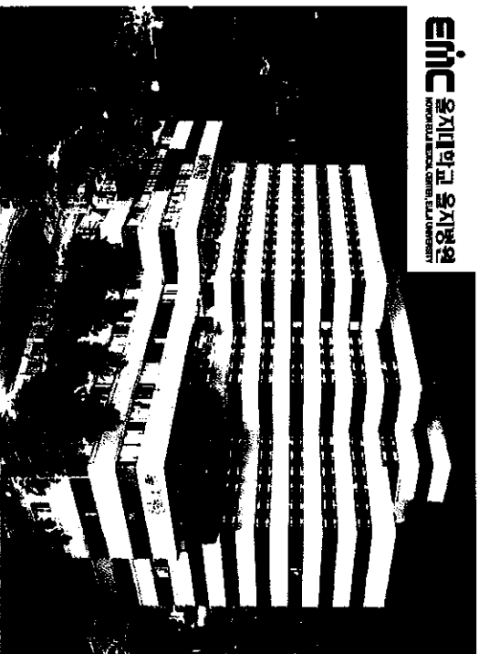
eljiC 을지대학교 을지병원 EULJI UNIVERSITY MEDICAL CENTER EULJI HOSPITAL